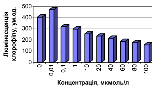
Рис. 2. Вплив хлористого кадмію на інтенсивність люмінесценції хлорофілу в листках Plagiomnium undulatum .

На наступному етапі досліджень ми вивчали проникнення адсорбованих іонів важких металів у клітини, тканини й органи. Об'єктом дослідження були листки моху P. undulatum (рис. 3).