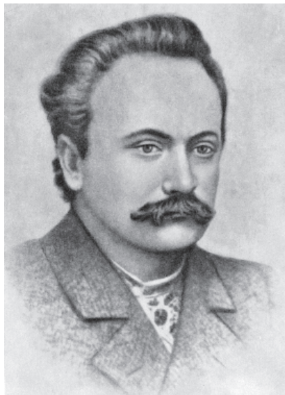
Іван Франко. Фото, 1903 р.