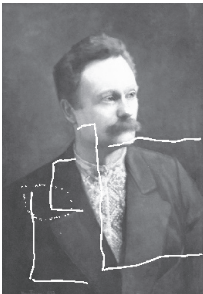
Іван Труш. Портрет Івана Франка. 1997 р. (полотно здубльоване, гризайль, 75,5 x 52,5 см). (траєкторія порізів полотна)

кольори) в своїх натурних студіях. Підтвердженням факту, що згаданий портрет створено не з натури, є також фотографія Франка, зроблена наприкінці 1893 р. Зображення на портреті 1897 р. за загальною композицією, ракурсом, освітленням, деталями збігається зі згаданою світлиною. Фотографія письменника свого часу була досить відомою, і Труш міг її побачити в журналі “Зоря”, де вона вперше була надрукована 1894 р. [6].