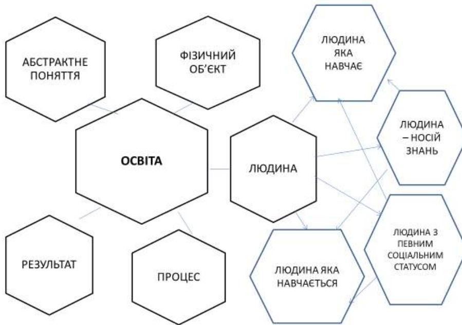
Рис. 1. Модель концептосфери ОСВІТА в мовній картині світу носіїв англійської мови

За допомогою статистичних методів визначено ядерні, центральні та периферійні конструкти концептосфери ОСВІТА в НМКС носіїв англійської, обчислено номінативну густину концептів та концептуальних полів. З'ясовано, що концепти та концептополя досліджуваної сфери не є однорідними за кількісно-якісними характеристиками, їх доцільно аналізувати за індивідуальними моделями. Спільними елементами залишаються ієрархічна будова та польова структура.